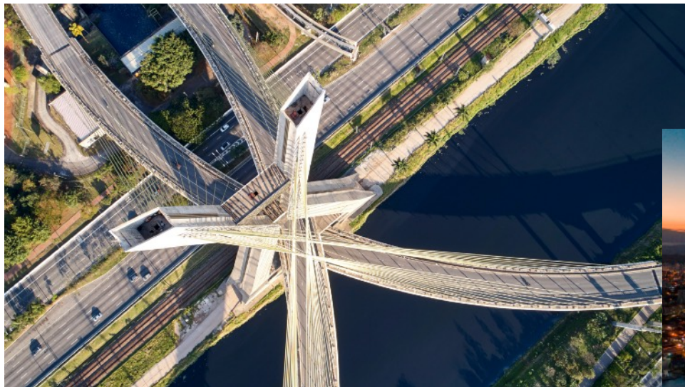
São Paulo, SP - Av Brigadeiro Faria Lima 3729, 5 andar - Itaim Bibi