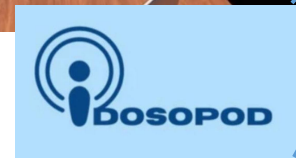
Figura 1. Logo do projeto